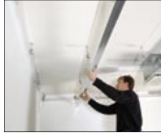
2 Powieś profil główny.