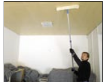
8 Oczyszcz panel.