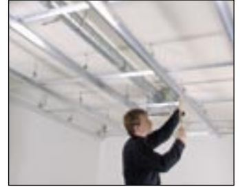
4 Zamontuj profile dystansowe co 1200 mm.