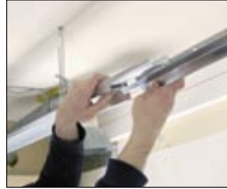
3 Połącz profile główne.