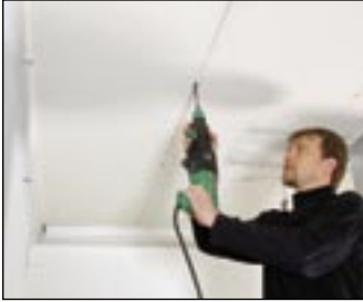
1 Wywierć otwór na zamocowanie wieszaka.