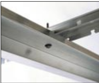
5 Zabezpiecz przed rozpięciem za pomocą wkręta samowierzącego.