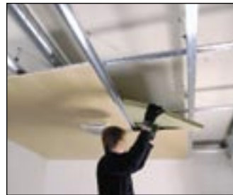
7 Ułóż izolację z wełny mineralnej.